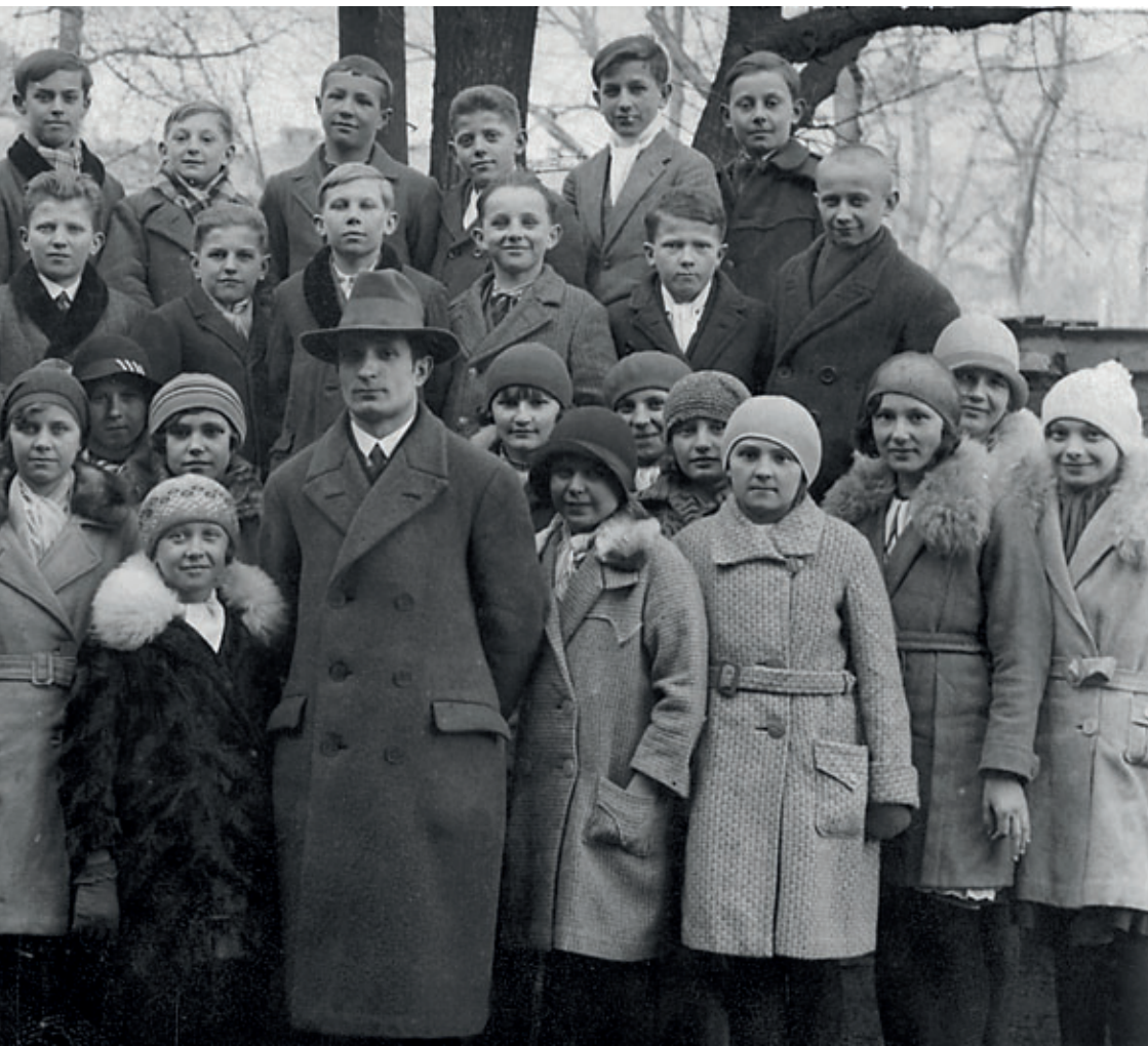
Foto z r. 1931: dne 7. března Jistebničtí zpěváci poprvé zpívali v ostravském rozhlasu (zpívalo se přímo, bez natáčení) Závěrem je před rozhlasem vyfotografovali.

Začátky jeho učitelského působení jsou spojeny s legendárními Jistebnickými zpěváčky (1929 – 1938).